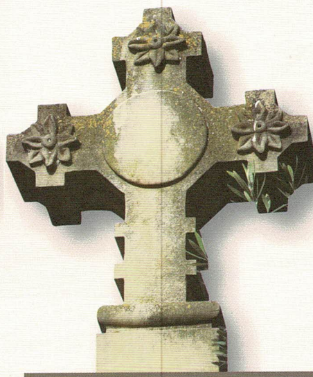
Creu dels Cirerers