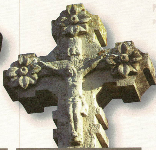
Creu de la Pelegrina