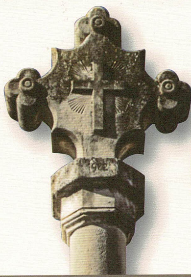
Creu de la Creueta