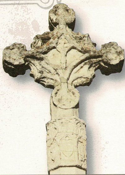
Creu de Sant Salvador