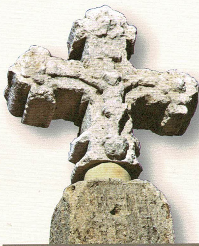
Creu de Santa Digna